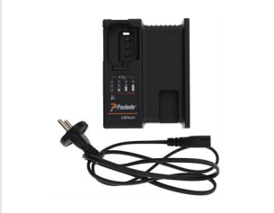
Artikel-Nr. 018881 Impulse Lithium Ladegerät