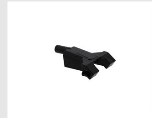
Artikel-Nr. 019784 Nase verd. Fussbodennag. Xi