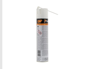
Artikel-Nr. 115251 Reinigungsspray (300 ml)