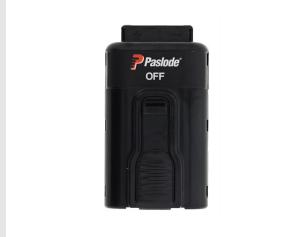
Artikel-Nr. 018880 Impulse Lithium Akku