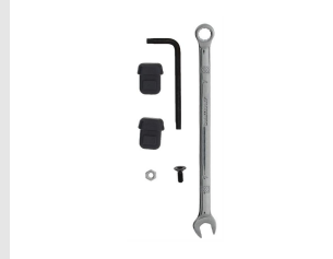
Artikel-Nr. 013256 Ersatzgummi empf Nase IM90 / 100