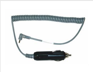
Artikel-Nr. 900507 Kfz Ladekabel