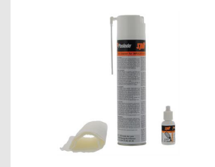
Artikel-Nr. 013690 Impulse Reinigungsset