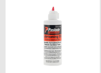
Artikel-Nr. 401482 Impulse Öl (115 ml)