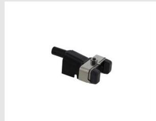
Artikel-Nr. 019783 Nase empf. Oberfläche Xi