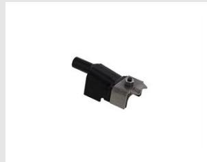
Artikel-Nr. 019785 Nase Metaldächer Xi